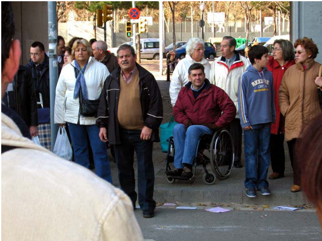
Canal*ACCESSIBLE, Barcelone, 2007