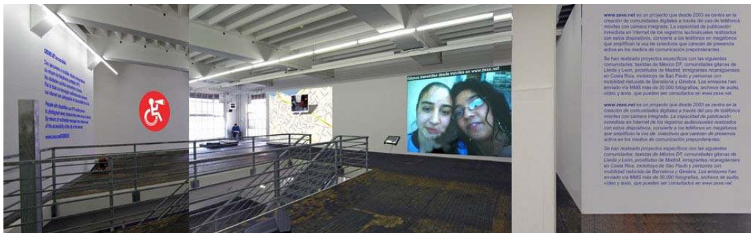
GENEVE*accessible – Antoni Abad, vue simulée de l'exposition au Centre d'Art Contemporain Genève