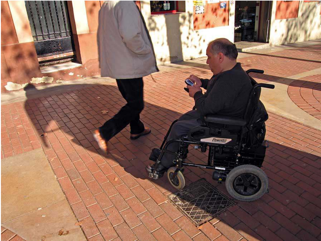
Canal*ACCESSIBLE, Barcelone, 2007