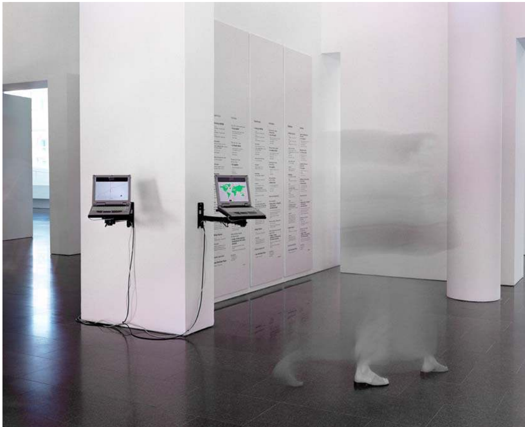
Canal*ACCESSIBLE, vue de l'exposition au MACBA, Barcelone, 2002