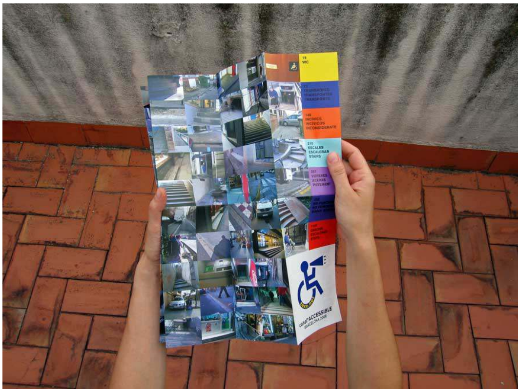
« CANAL*accessible », plan recensant les inaccessibilités, Barcelone, 2006