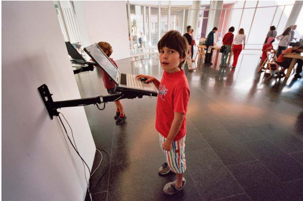
Canal*ACCESSIBLE, vue de l'exposition au MACBA, Barcelone, 2002