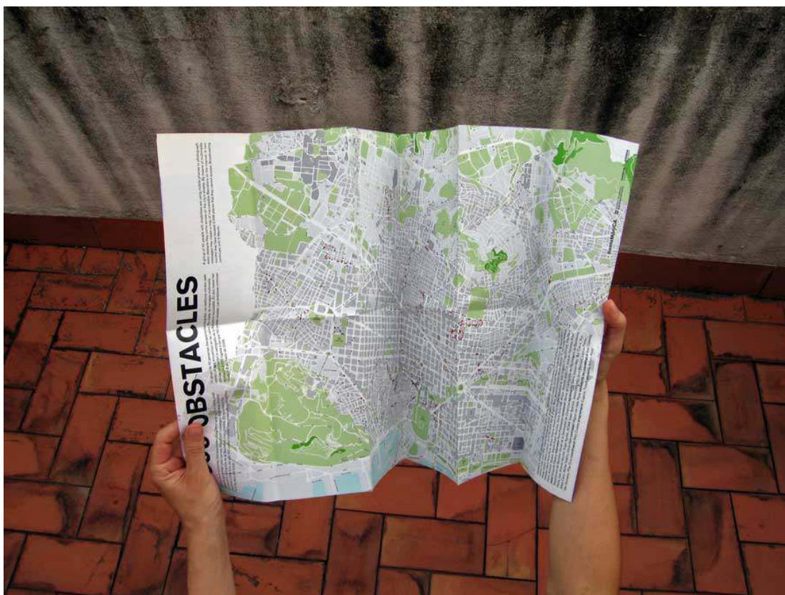
« CANAL*accessible », plan recensant les inaccessibilités, Barcelone, 2006