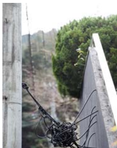
« EMBRASSE », 2009 Fils électriques Nylon, graviers Dimensions variables