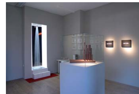
Let's take a shower together, vue de l'exposition, Mars 2010, TMproject.