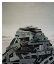
Mount Holy, 2009, huile sur toile, 120 x 100 cm