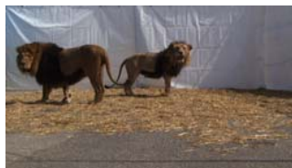
Il Nonno (HDV en boucle (3' 33"), sans son), 2009/10 © Luzia Huerzeler