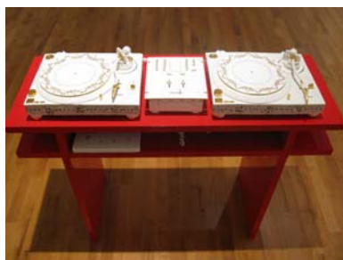
Back in the good old days, 2009