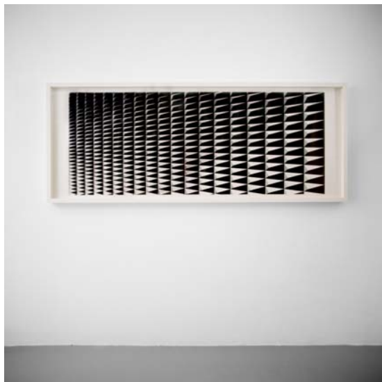
ICE CREAM MAN ON EDGE, 2010 Graphite et crayon noir sur papier, 85 x 210 cm