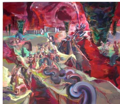
Golden Valley 2009 acrylique et pastel gras sur toile, 200 x 230 cm