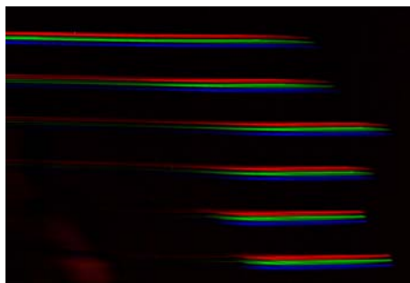
Pendulum Ghosts (serie) - detail Epson Ultrachrome K3 on Blueback paper 150x110cm, tirages uniques, 2010