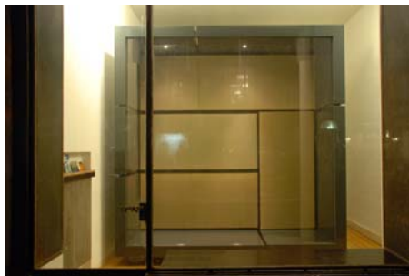
Quatre tatamis et demi, 2009 Structure: aluminium thermolaqué, plexiglas Intérieur: tatamis Taille: 300cmx300cmx90cm Photographie © Cruz Jean-Gabriel (octobre 2009) Pièce présentée dans le cadre des bourses