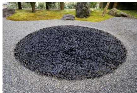
« PARADE », 2009 Nylon, graviers Dimensions variables