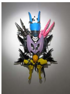
Pérystyle, 2009