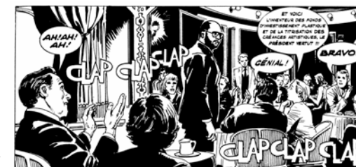
Dessin de la série The Great Business'n all Swindle , 2010 12 sérigraphies sur papier.

On y trouve notamment des esquisses de solutions aux problèmes contemporains. Alors que The 22 nd Century Woman présente un projet d'adaptation de la femme moderne à un environnement où s'entrechoquent pêle-mêle football, jeux vidéo et question religieuse, les différents éléments du Seefood Project proposent des solutions plastiques radicales à l'épuisement des ressources océaniques.