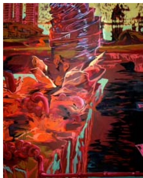
Gazoduc 2007 huile et acrylique sur toile, 191 x 217 cm

De façon concrète, mon travail réfléchit et se débat avec les notions de nationalisme, d'authenticité, d'héritage historique et culturel. Il est un lieu de re-questionnement de nombre de valeurs esthétiques établies.