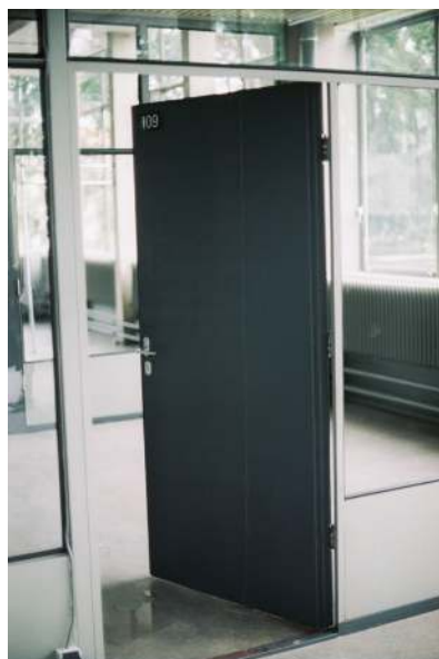
Bastien Gachet, Chest , 2015 et Crying Door , 2015.