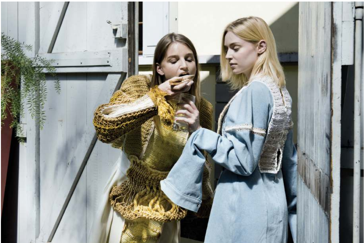
Zora Oberhänsli, Les Ambrazurs , 2016. modèles : Stéphanie Bircher et Nora Vetterli, maquillage : Anaïs Vigliano, assistant : Sébastien Biass