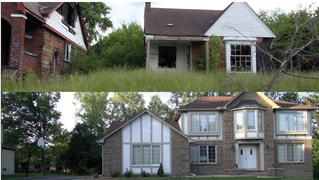
Emmanuelle Bayart, en collaboration avec Timo Kirez, NOTOWN , 2016, HD, 16/9, couleur, film en cours de réalisation, sera présenté lors des bourses

Vis-à-vis de la démarche documentaire qui est au coeur de mon travail photographique, en vidéo, mon approche est marquée par une prise de distance plus nette par rapport au sujet. Par l'alliance du texte et de l'image, je crée une narration visuelle et sonore, une fiction inspirée du réel, qui le réfléchit. En cela, le son, le mouvement et la temporalité ont ouvert le champ des possibles et me permettent, par leur orchestration, de donner de la profondeur à l'image, tout en la questionnant, et de créer une intrigue.