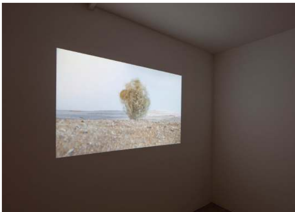
Delphine Depres, REVERSE , 2015. Vue d'exposition à la Villa Berasconi