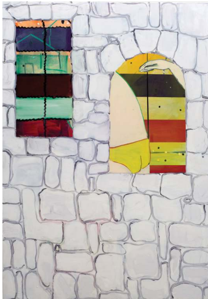
Zara Idelson, Sans titre, 2016

Le rideau est un premier plan qui apparaît régulièrement. Souvent une manière de référencer d'autres peintures et d'autres époques. C'est aussi une stratégie pour intégrer des éléments décoratifs dans la composition.