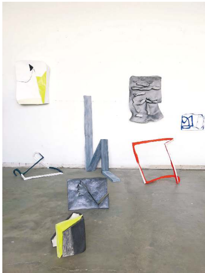
Simone Holliger, Marfa-Series , 2015. Mixed media, dimensions variables.

Le travail de Simone Holliger est un équilibre délicat entre fragilité et solidité, entre ajout et soustraction, troublant la compréhension des éléments. De la même façon, ses pièces se répondent et s'opposent constamment, créant un paysage, un panorama sans frontières définies aux lectures diverses. Il est bien question pour elle de traverser des espaces fragmentaires, de jouer avec les interstices séparant les éléments sur le mur et dans l'espace, d'exploiter les ombres portées pour les faire participer à la syntaxe d'un ensemble indivisible et de considérer le vide du mur blanc entourant les œuvres comme une respiration, une circulation, une ponctuation. Il s'agit donc, contre toute abstraction, d'agencer l'œuvre dans la réalité très concrète de son espace d'accrochage.