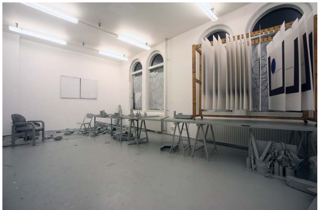
“Through the Windows”, 2009, installation (médias mixtes).