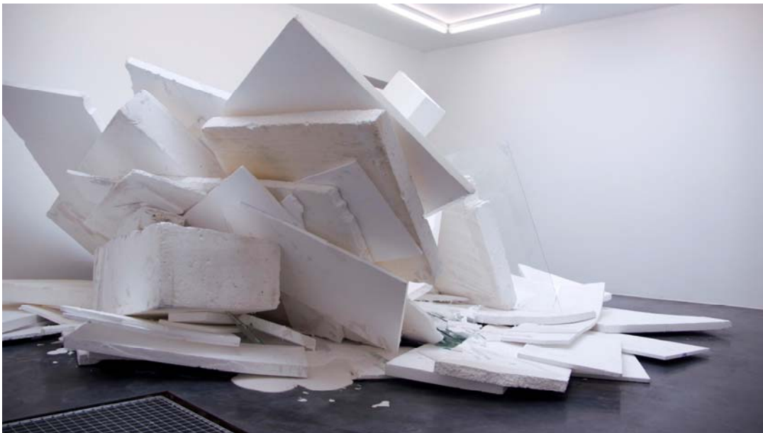
“IceCollapseAndCrack”, 2009, installation (polystyrène, verre, plâtre).