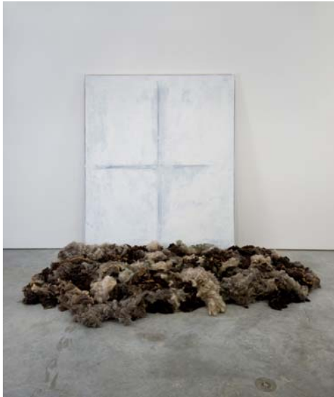
“Windows”, 2009, installation (huile sur toile et laine de mouton) Courtesy de l'artiste et Gavin Brown's enterprise. Photo: Thomas Mueller