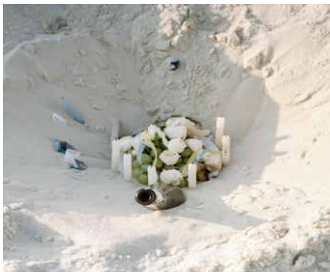
Saúde e Prosperidade (issue de la série Macumba, 2013)

La série Macumba expose cette fascination. A Rio de Janeiro, la fête de la déesse lémanja, mère de tous les Orixas et reine des océans s'est fondue dans le paysage culturel populaire. Au 31 décembre, les plages cariocas sont parsemées de ces autels d'offrandes à la divinité, des natures mortes composées avec grand soin tels des tableaux, par des gens qui sans le savoir rendent ces rites d'une incroyable beauté graphique. Laissant ainsi entrevoir l'esquisse d'une installation, une sculpture de fortune, un «happy accident». Le hasard des dispositions, l'altération du temps et de la nature laissent entrevoir un univers lyrique, la magie des prières et des esprits, où tant d'histoires peuvent être comptées et imaginées. Les photographies vont de pair avec des sculptures créées à partir des informations colorimétriques digitales générées par les programmes de retouche. Cette représentation numérique de données analogues interroge notre perception de l'image, de la couleur et de la lumière d'une photographie qui devient ainsi une matérialisation tangible en trois dimensions, un portail entre la réalité et la subjectivité.