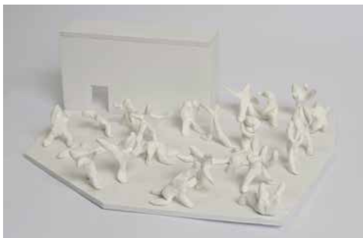
Battle for Kunsthalle, 2012 Carton, terre, colle, environ 30X 16cm.

Il s'agit d'un format dans lequel on se rend compte à la fois des absurdités de ce monde et du confort de l'anecdote. Ainsi, plus qu'être en présence d'une sculpture, le spectateur devient complice de l'objet et de l'idée qu'il renferme. Un paramètre me semble encore très important. C'est la notion de reliques, qui me donne avant tout un sentiment d'identité et de sécurité. Toujours avec cette idée de boulimie/délestage, je considère que je sème mes objets dans mes déplacements. C'est aussi une manière d'exorciser mes excès qui sont récurrents dans mes expériences, mais aussi dans ma manière de vouloir les transmettre.