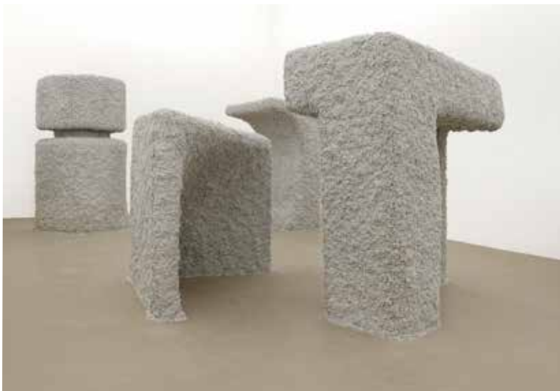
Édicules Lainés, bois nergalto, laine de roche dimensions variables, 2013 Vue de l'exposition Rendez-vous 13, 10 septembre – 10 novembre 2013, Institut d'art contemporain, Villeurbanne/ Rhône-Alpes

Nicolas Momein développe un travail de sculpture qui emprunte ses modes de production à différents métiers dont il explore les savoir-faire et les usages. Ses sculptures se nourrissent de matériaux hétérogènes, qui mobilisent des gestes assimilés dans le temps, de manière empirique. Nicolas Momein revendique une posture d'apprenti : « Ces situations, explique-t-il, m'amènent à développer une économie de travail collaborative vers une production qui s'appuie sur des procédés et des matériaux affectés à des tâches habituellement peu visibles et peu considérées ». Nicolas Momein présente un ensemble de structures recouvertes de laine de roche, qu'il nomme édicules lainés. Construites en bois et grillage, leur ossature s'inspire des petites constructions (édicules) qui jalonnent l'espace public, comme les abribus ou les cabines téléphoniques. L'artiste accorde une forte présence physique aux objets, à leur volume et à leur texture, jouant notamment sur la couleur de la laine de roche et sur ses qualités d'isolant thermique et phonique. Un matériau léger et fragile, qui semble « flouter » les contours de ses objets à mi-chemin entre sculptures et architectures. Proposant une relecture de ces formes usuelles, il réalise des formes intermédiaires qui mettent en tension leur dimension sculpturale et leur fonctionnalité potentielle.