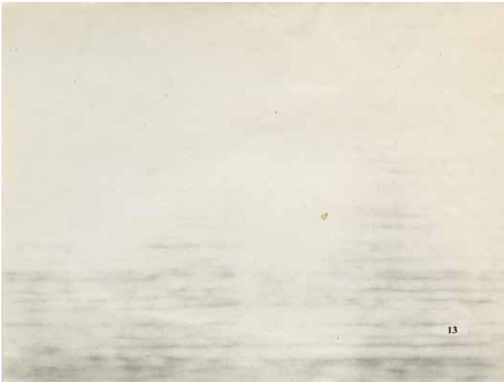
"Sans titre", 2013