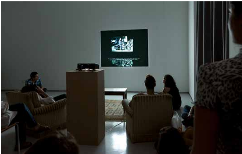
Installation Album de famille (2011)

Cette fiction est tissée de la réalité de différentes personnes, dont l'artiste. Cette juxtaposition permet au spectateur de pouvoir se reconnaître dans le discours et de comprendre à quel moment du processus il se trouve.