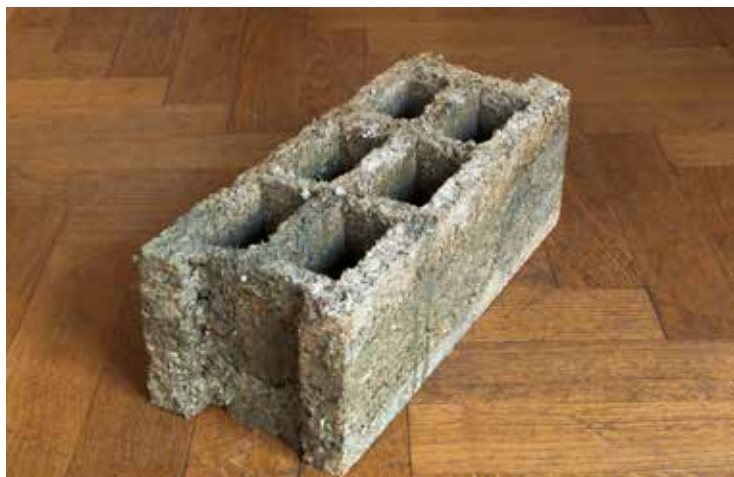
Baustein #1, 2013, Sciures de bois, ciment, 20 x 20 x 50 cm.