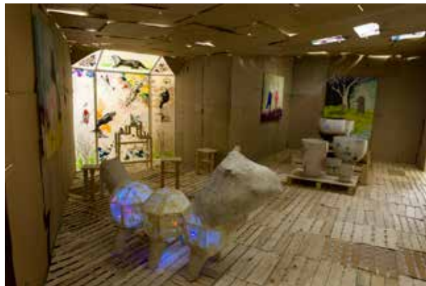
Rest 2011, Mixed media, Vue d'installation à la Galerie de la Marine, Nice - France

2009 Bourse O.F.A.J. (Office Franco-allemand pour la Jeunesse)