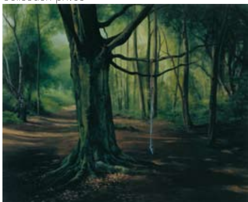
“Scenes from the Passion: The Rope”, 2004 Peinture à l’émail sur bois, 43 x 53 cm Collection privée