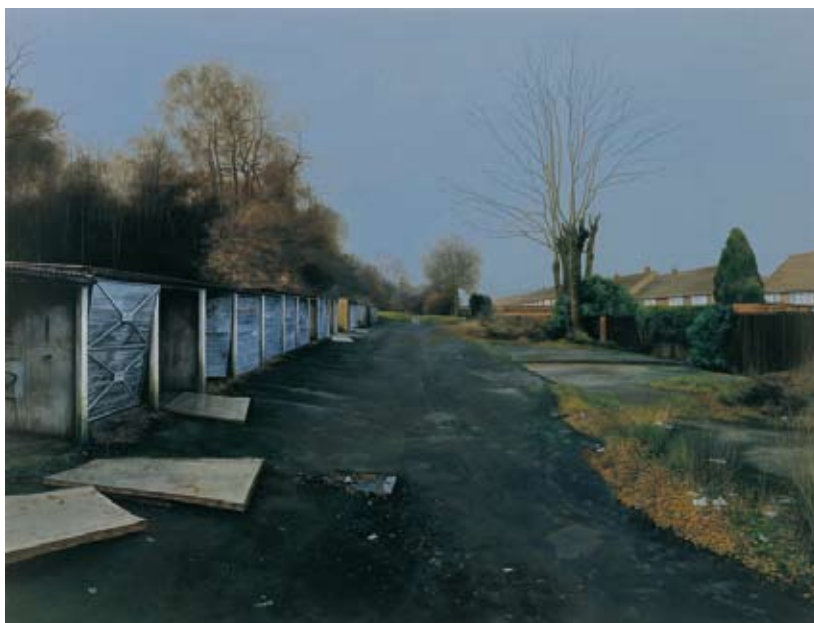
“Scenes from the Passion: The Anniversary”, 2004, peinture à l’émail sur bois, 92 x 121 cm Collection privée