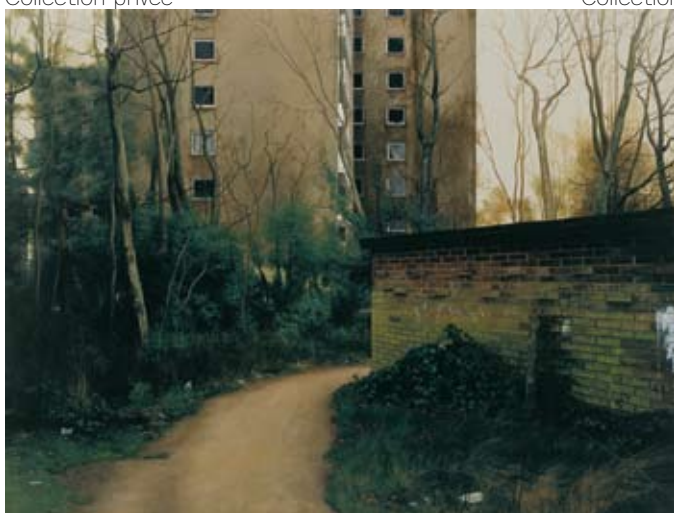
“Scenes from the Passion: Valentines Day”, 2004 Peinture à l’émail sur bois, 43 x 53 cm, Collection privée