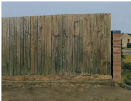
“Ash Wednesday: The Bank Holiday”, 2004/5 Peinture à l’émail sur bois, 92 x 121 cm Collection privée