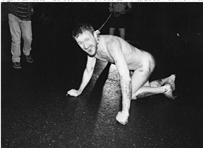
Oleg Kulik, « Reservoir Dog », 1995, vidéo

POUR PLUS D'INFORMATIONS ET L'OBTENTION D'IMAGES, veuillez contacter Aurélien Gamboni au +41 22 329 18 42, e-mail : presse@centre.ch