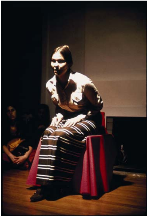
Faith Wilding, "Waiting", performance, 1972