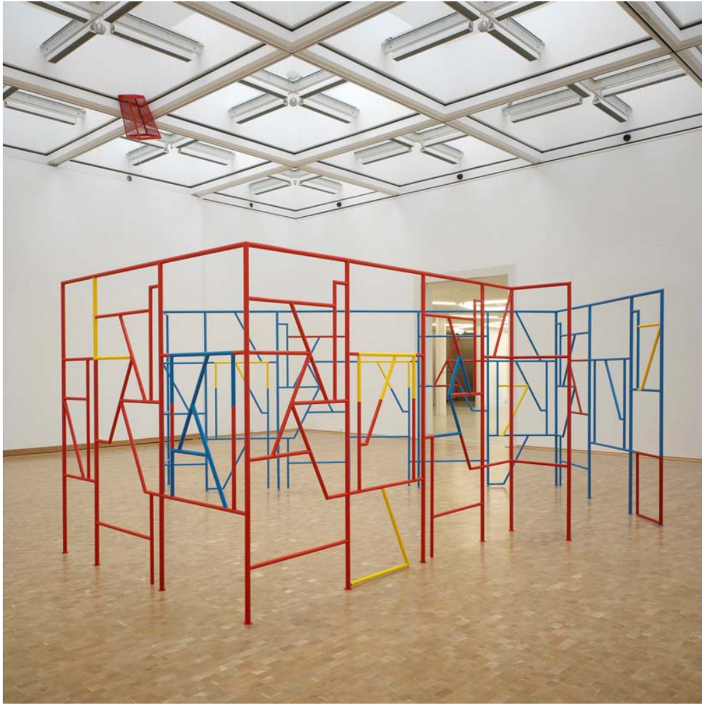
«Strange I've Seen That Face Before», 2006