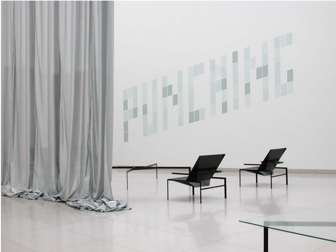
«For 1959 Capital Avenue», Museum für Moderne Kunst, Frankfurt am Main, 2002