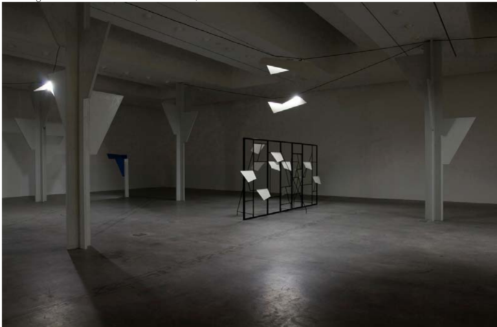
«Electric Trees and Telephone Booth Conversations», 2006